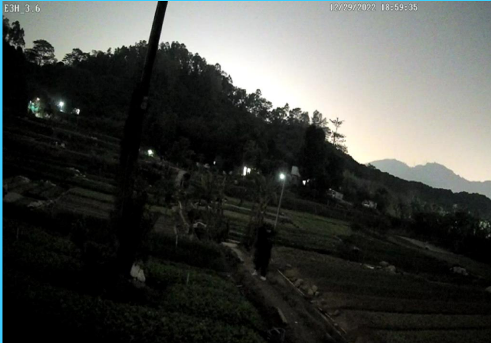
Звичайна ISP IPC

За допомогою алгоритму ШІ С3Н серії , розроблені на основі AI ISP (Опрацювання сигналу зображення), різко покращують обробку зображення з шумоподавленням, передача кольорів, WDR, HLC і т.ін.