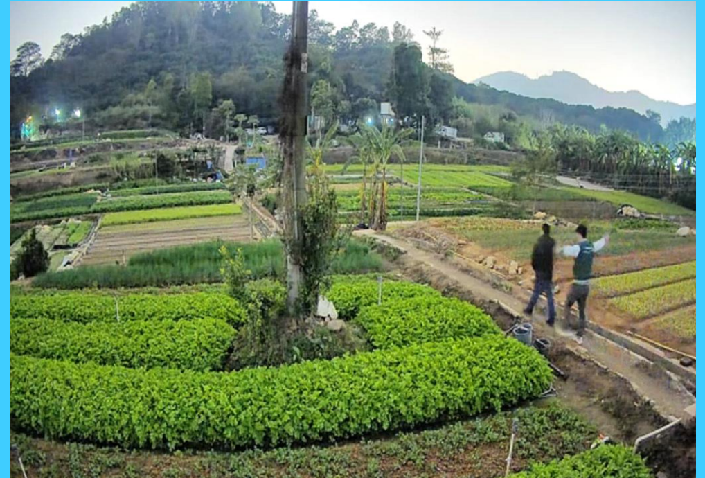
AI ISP C3H Full Color IPC